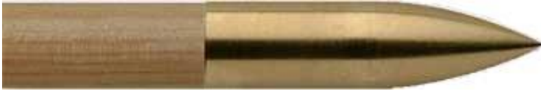
Top Hat Bullet Messing/Stahl